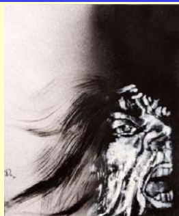
نقاشی از دلارا دارابی