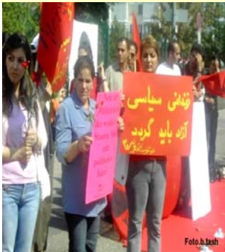
میتینگ اعتراضی در فرنگفورت- آلمان

زندانی سیاسی بی قید و شرط آزاد باید گردد! مرگ بر جمهوری اسلامی ۱۳ مرداد ۸۵ سازمان آزادی زن