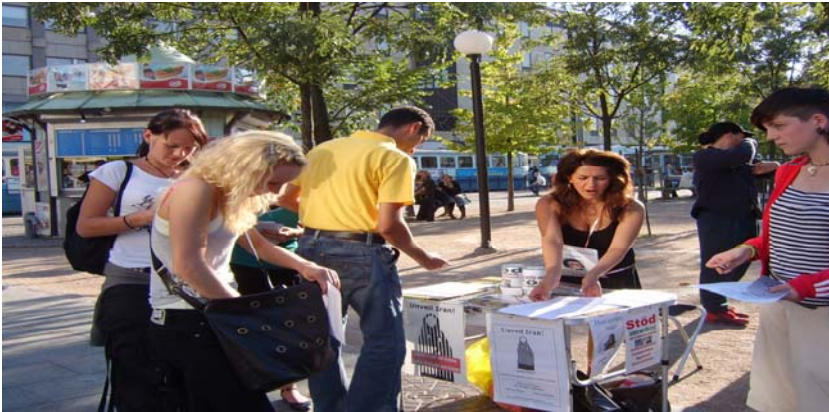
پیکت اعتراضی سازمان آزادی زن در سوند؛ در اعتراض به اعدام در ایران